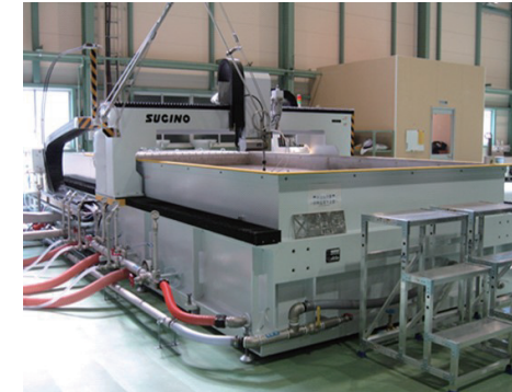
ウォータージェット切断機